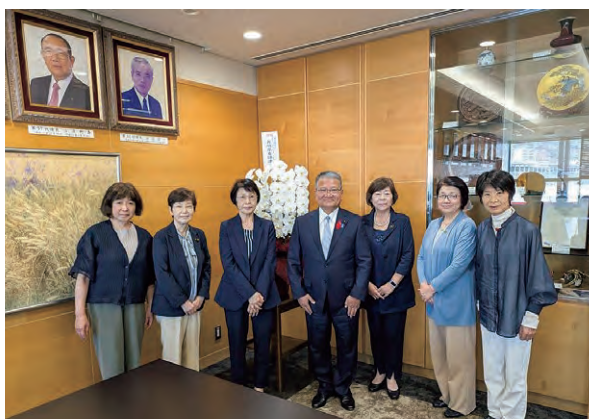
外間雅広長崎県議会議員