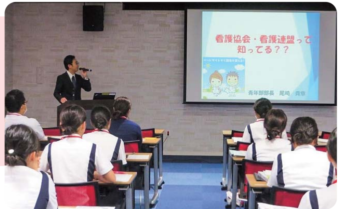
長崎みなとメディカルセンター