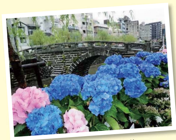
長崎の眼鏡橋と紫陽花