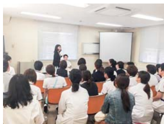
スキンケア研修会