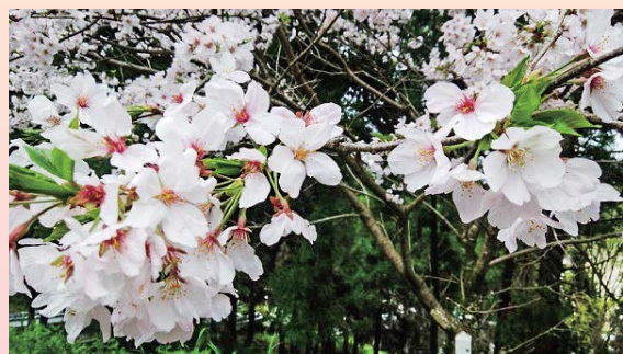
ながさき看護センター駐車場のさくら