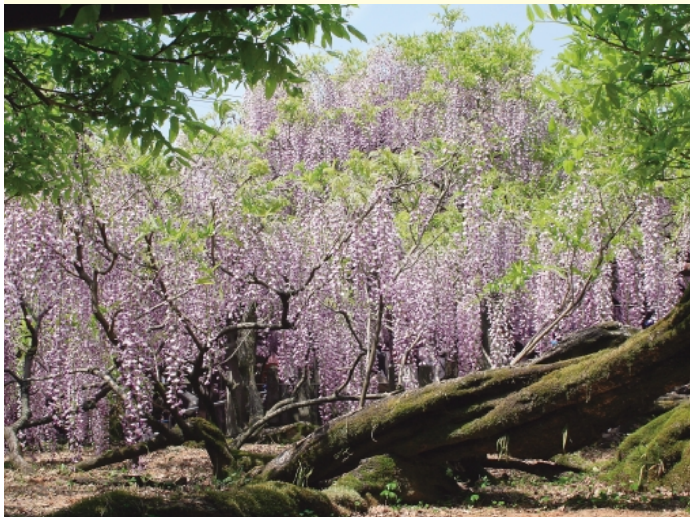
福岡 黒木の大ふじ