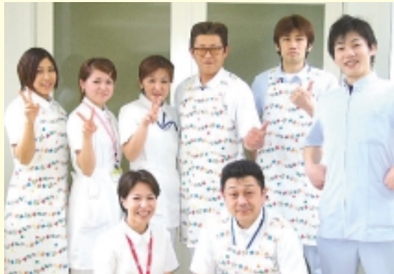
医療法人 健正会 大久保病院 長崎市戸石町