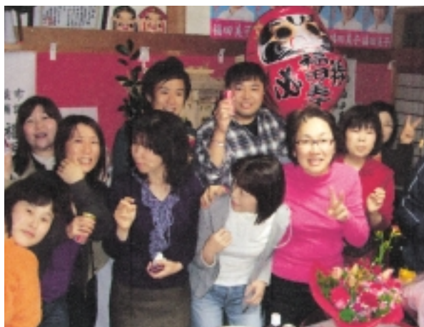
- 同窓会の仲間と -