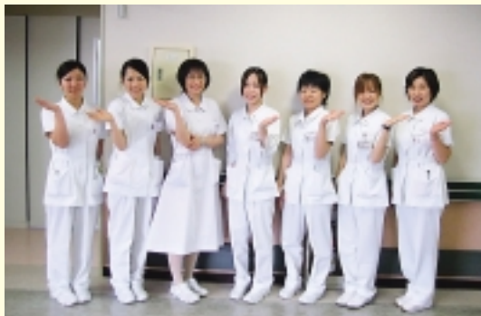
日本赤十字社 長崎原爆病院 長崎市茂里町 3 - 15

22ポイント! 定床150床(一般病棟90床 回復期リハビリ病棟60床)の島原半島西部地域の中核病院として頑張っています。当院のユニフォームは、5年毎に更新され、昨年リニューアルされたばかりです。襟に特徴があり、ボタンをしたり、しなかったりと気分に合わせています。ちなみに 開院した当初は ワンピーススタイルもありましたが、現在は すべてパンツスタイルに変わり フットワークも軽く、当院の理念である「心をこめて患者様のために」をモットーによりよい看護を目指しています。