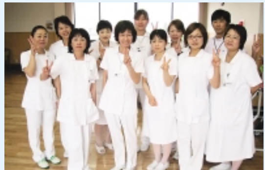
医療法人慧明会 貞松病院 大村市東本町537

22ポイント! 当院のユニフォームは、森英恵さんがデザインされたもので日赤共通の白衣です。タイプはパンツスタイルとワンピースタイプがあり、業務や処置に合わせて自由に選択できます。また、ナースシューズも3タイプから選べます。当院では、動きやすいパンツスタイルの白衣が愛用されています。白衣は白一色のみですが、私たちは「白」のイメージである清潔感を大切に、いつも新鮮な気持ちで患者様に接しています。