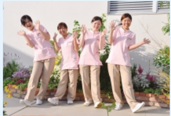
社団法人 是真会 長崎リハビリテーション病院 長崎市銀屋町4番11号

勿論清潔感を第一と考えているのですが、胸元の名札ストラップにピンク・ブルー・紺色などを使い白衣のお洒落を工夫しています?! 長期療養のご高齢の方々に「明るく・楽しく」をモットーに食事時には専用のエプロンをつけ雰囲気作りに貢献しています。男性人の“エプロン姿”意外と喜ばれています。メタボも隠す さわやかムード 満開です