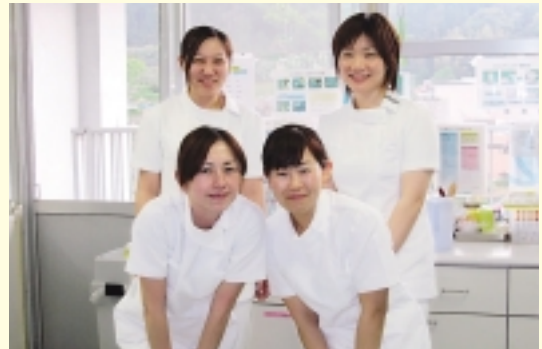
医療法人三俊会 公立新小浜病院 雲仙市小浜町南本町93

22ポイント! フェリーで奈良尾港に着くと、目の前の山の上に奈良尾病院がたっています。病院からはオーシャンビューが広がり桜の季節には素晴らしい景色を観ることができます。ここで働く私たちはさわやかなブルーのユニフォームで、笑顔を決やさず、元気に患者様に接することをモットーに頑張っています。