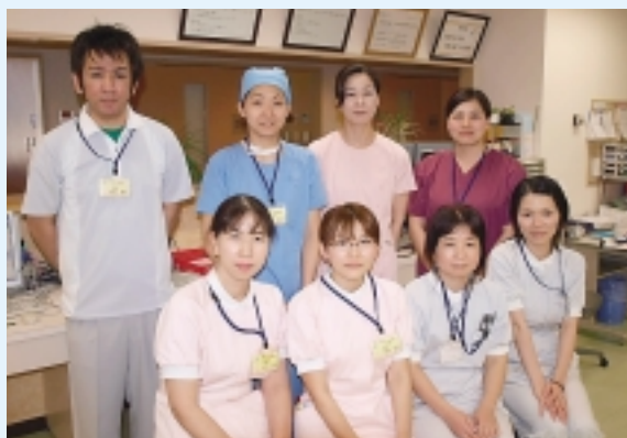
長崎県病院企業団 長崎県上五島病院 南松浦郡新上五島町青方1549 - 11

当院は昨年2月に開院しました。病院らしくない病院を創りたいという想いから、ユニフォームにおいても委員会を立ち上げ、何回も検討を重ねました。“すっきりスマートにみえるシルエット・仕事をしなやかにサポートする素材・患者さまに与えるイメージを想定した色”のコンセプトから出来上がったものです。また、名札が見えるような胸ポケット等の工夫を凝らしています。ちなみにピンクは、柔らかなイメージで愛情を表現しています。看護師にピッタリですよ。