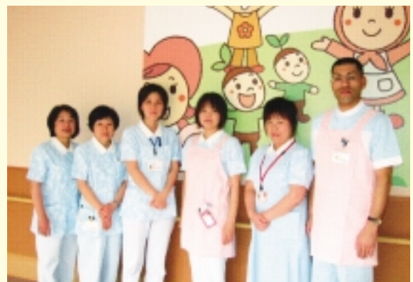
長崎県立こども医療福祉センター 諫早市永昌東町24 - 3

五島にお越しの際には、ちょっと足をのばして、当院へ見学にお出でになりませんか。お待ちしております。