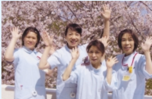
長崎県病院企業団 長崎県奈良尾病院 南松浦郡新上五島町奈良尾郷712 - 3

22ポイント! フェリーで奈良尾港に着くと、目の前の山の上に奈良尾病院がたっています。病院からはオーシャンビューが広がり桜の季節には素晴らしい景色を観ることができます。ここで働く私たちはさわやかなブルーのユニフォームで、笑顔を決やさず、元気に患者様に接することをモットーに頑張っています。